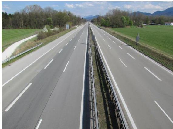
Leere A8 bei Übersee während der Osterferien 2020

Spannend wird aber sicher, wie es nach den aktuellen Einschränkungen weitergehen wird. Nach der letzten schweren Krise 2008 wurde die sogenannte Abwrackprämie eingeführt, um den Absatz von Pkws zu fördern. Umweltaspekte standen damals nicht im Vordergrund, es floss massiv Geld in die Wirtschaft. Dies wird auch jetzt nötig sein, um Unternehmen und Jobs zu sichern. Aber haben wir dann etwas aus den letzten Wochen gelernt? Jetzt hätten wir die Chance, endlich eine der viel beschworenen Wenden umzusetzen: brauchen wir wirklich noch mehr Geld für Autobahnen und Umgehungsstraßen? Wenn nur die Hälfte